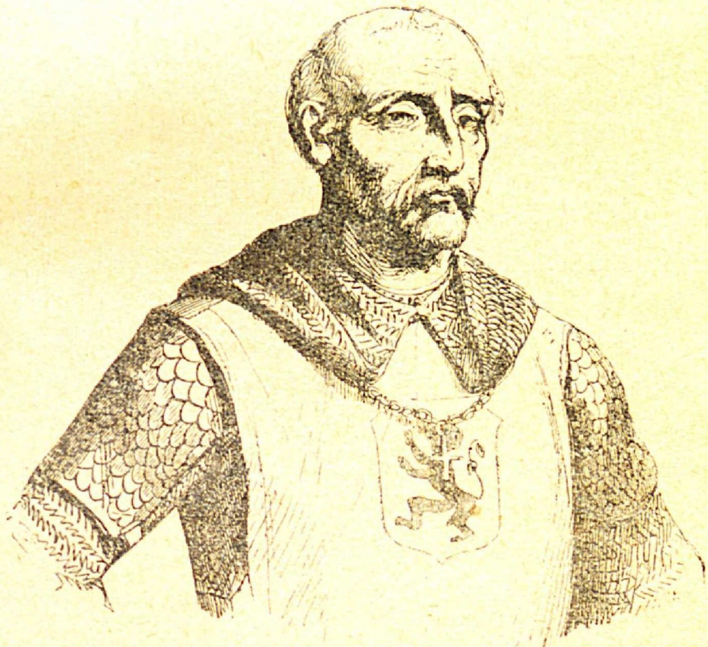
Gwijde van Dampierre, graaf van Vlaanderen.