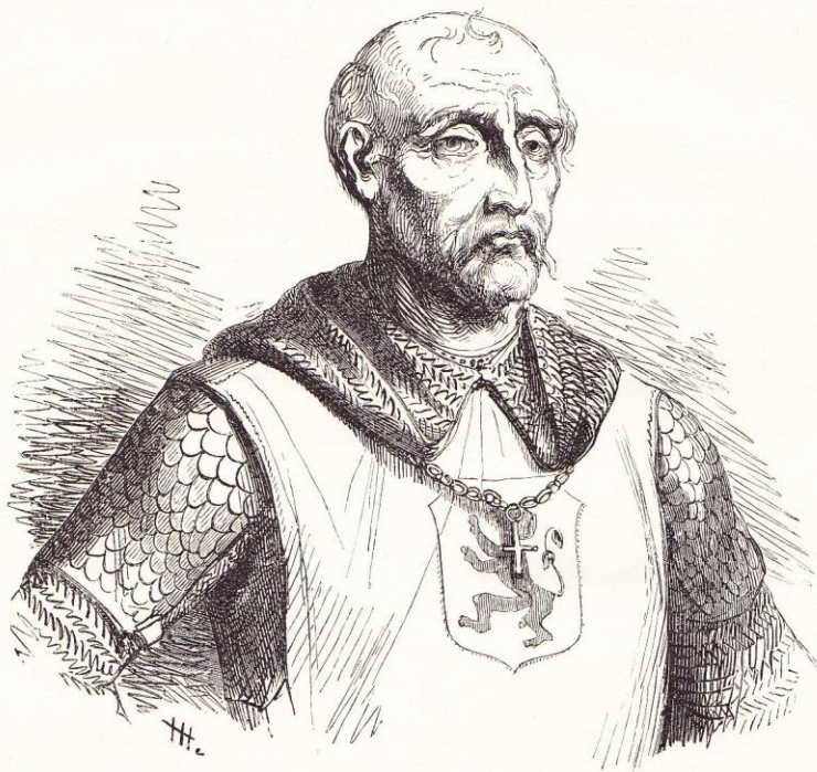
GWIJDE VAN DAMPIERRE.

Naarmate de steden meer onafhankelijkheid