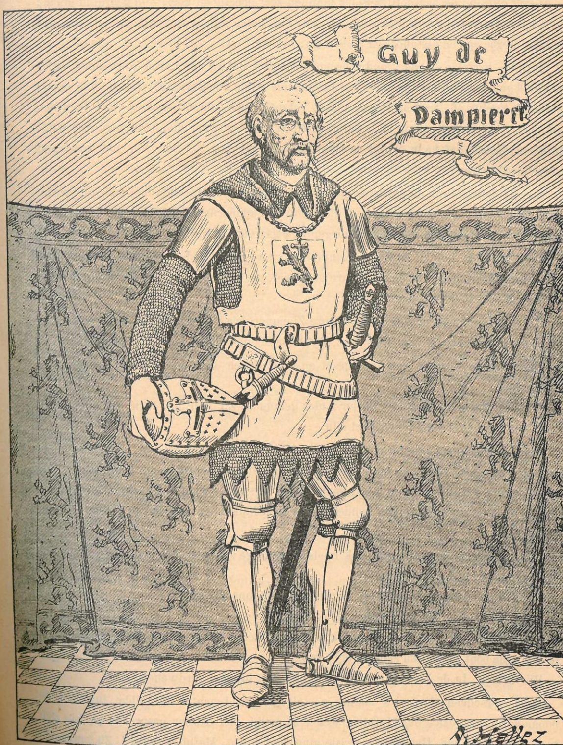
Gwijde van Dampierre